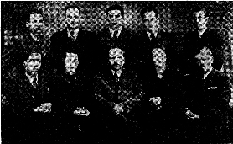
קאמיטעט פון האנדלס-אנגעשטעלטע אין פשעמישל.

אזוי האט אויסגעזען די „קלאסן-ברודערשאפט“ פון די יידן מיט די פאליאקן און מיט די אוקראינער.